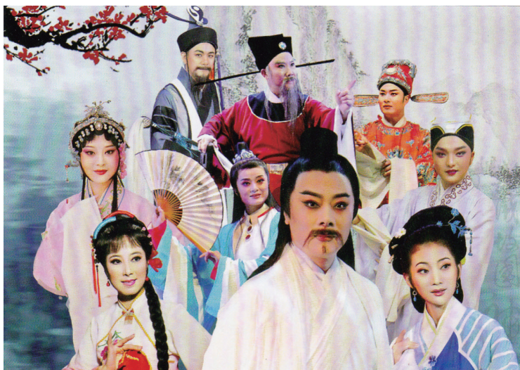
中國黃梅戲王子張輝領銜演出之黃梅大戲～蘇東坡演員劇照