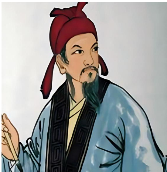
飄泊顛沛詩人—李商隱

日益艱困，「四海無可歸之地，九族無可倚之親。」！在這嚴峻的環境中，促使他勤奮讀書，獵取功名，以圖振興家道。後來他跟隨一位積學的堂叔學習質樸的古文，寫得一手漂亮的毛筆字。